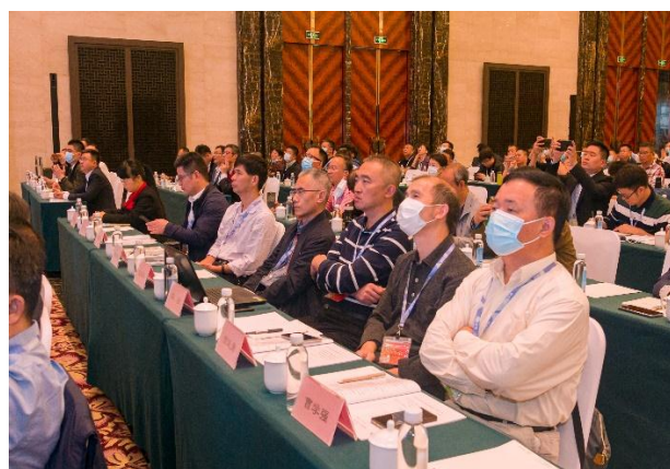
第二十三届国际热喷涂研讨会暨第二十四届全国热喷涂年会现场