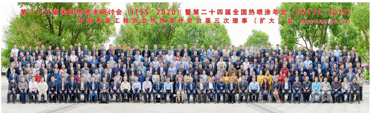
参会部分代表合影

金秋十月，在国内外热喷涂界同仁的大力支持和筹备组的精心组织下，由中国表面工程协会热喷涂分会主办，宜兴市力生环保化工有限公司承办，航天材料及工艺研究所（703所）、中国科学院上海硅酸盐研究所、宝武装备智能科技有限公司、广东省科学院新材料研究所、中国科学院金属研究所、西安交通大学材料科学与工程学院、江门市威霖贸易有限公司、武汉材料保护研究所有限公司、天津铸金科技开发股份有限公司、上海岐海防腐工程技术有限公司、上海新业喷涂机械有限公司、洛阳金鹭硬质合金工具有限公司、欧瑞康美科表面技术（上海）有限公司、泰尔（安徽）工业科技服务有限公司、北京联合涂层技术有限公司、中国航发航空科技股份有限公司、沈阳石花微粉材料有限公司、中国航发沈阳黎明航空发动机有限责任公司、成都振兴金属粉末有限公司、湖南兆益热喷涂材料有限公司、株洲江钨博大硬面材料有限公司、无锡市新科表面工程材料有限公司、中国航空制造技术研究院、自贡长城硬面材料有限公司、东方汽轮机有限公司材料研究中心、江西恒大高新技术股份有限公司、温州耐密特阀门有限公司、北京航天振邦精密机械有限公司、武汉立通先进科技有限公司、鞍山正发表面技术工程股份有限公司、大连华锐重工特种备件制造有限公司、上海凯林新技术实业公司、江苏武进液压启闭机有限公司、无锡科特金属表面处理有限公司、北京华德星科技有限责任公司（德国IMPACT公司总代理、瑞士TPS公司中国总代理）、浙江星塔科技设备材料有限公司、成都市长诚热喷涂技术有限责任公司、北京一同海瀛商贸有限责任公司（英国Metallisation公司总代理）、武汉理工大学、西安宇丰喷涂技术有限公司、洛阳朗力表面技术有限公司、武汉高力热喷涂工程有限责任公司、安徽省淮海工程科技有限公司、北京航百川科技开发中心、北京工业大学、北京理工大学、北京航空航天大学、安徽工业大学、德国阿亨大学表面工程研究所、《材料保护》杂志社、瑞士Oerlikon Metco公司、日本TOCALO公司、美国PRAXAIR/TAFA公司、瑞典HOGANAS公司、法国圣戈班公司、德国热喷涂协会（GTS）、英国METALLISATION公司、美国金属学会热喷涂学会（ASM-TSS）、荷兰FST公司、日本溶射学会、日本溶射工业协会等协办的第二十三届国际热喷涂研讨会（International Thermal Spraying Seminar' 2020）暨第二十四届全国热喷涂年会（China National Thermal Spraying Conference' 2020），于2020年10月27-29日在宜兴市成功举行，并同时召开了中国表面工程协会热喷涂分会六届三次理事（扩大）会。本届大会的主题为“同舟共济，开拓市场，相互协作，共克时艰”。