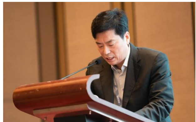
安云岐副理事长主持六届理事会成员调整，增补等事宜