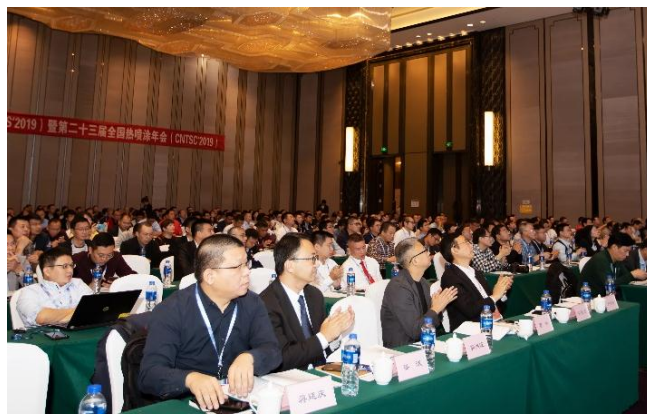
第二十二届国际热喷涂研讨会暨第二十三届全国热喷涂年会现场