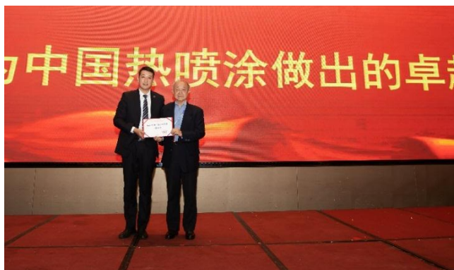
周克崧院士为徐滨士院士颁奖 (由徐滨士泰尔重工工作站黄东保代领)