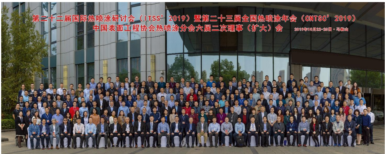
参会部分代表合影

在国内外热喷涂界同仁的大力支持和筹备组的精心组织下，由中国表面工程协会热喷涂分会主办，安徽泰尔表面技术有限公司、泰尔重工股份有限公司承办，航天材料及工艺研究所（703所）、中国科学院上海硅酸盐研究所、上海宝钢工业技术服务有限公司、广东省新材料研究所、中国科学院金属研究所、天津铸金科技开发股份有限公司、江门市威霖贸易有限公司、上海岐海防腐工程技术有限公司、武汉材料保护研究所有限公司、西安交通大学材料科学与工程学院、上海新业喷涂机械有限公司、洛阳金鹭硬质合金工具有限公司、欧瑞康美科表面技术（上海）有限公司、北京联合涂层技术有限公司、上海大豪瑞法喷涂机械有限公司、中国航发航空科技股份有限公司、成都振兴金属粉末有限公司、沈阳石花微粉材料有限公司、湖南兆益热喷涂材料有限公司、无锡市新科表面工程材料有限公司、中国航空制造技术研究院、中国航发沈阳黎明航空发动机有限责任公司、自贡长城硬面材料有限公司、株洲江钨博大硬面材料有限公司、江西恒大高新技术股份有限公司、北京航天振邦精密机械有限公司、东方汽轮机有限公司表面工程事业部、温州耐密特阀门有限公司、大连华锐重工特种备件制造有限公司、上海凯林新技术实业公司、安徽省淮海工程科技有限公司、无锡科特金属表面处理有限公司、北京华德星科技有限责任公司（德国IMPACT公司总代理、意大利ARTEC公司中国总代理）、鞍山正发表面技术工程股份有限公司、成都市长诚热喷涂技术有限责任公司、北京一同海瀛商贸有限责任公司（英国Metallisation公司总代理）、江苏武进液压启闭机有限公司、浙江星塔科技设备材料有限公司、武汉理工大学、武汉高力热喷涂工程有限责任公司、洛阳朗力表面技术有限公司、西安宇丰喷涂技术有限公司、北京航百川科技开发中心、武汉立通先进表面工程技术有限公司、北京工业大学、北京理工大学、安徽工业大学、北京航空航天大学、德国阿亨大学表面工程研究所、《材料保护》杂志社、瑞士Oerlikon Metco公司、日本TOCALO公司、美国PRAXAIR/TAFA公司、瑞典HOGANAS公司、法国圣戈班公司、德国热喷涂协会（GTS）、英国METALLISATION公司、美国金属学会热喷涂学会（ASM-TSS）、荷兰FST公司、日本溶射学会、日本溶射工业协会等协办的第二十二届国际热喷涂研讨会（International Thermal Spraying Seminar' 2019）暨第二十三届全国热喷涂年会（China National Thermal Spraying Conference' 2019），于2019年10月22-25日在马鞍山市成功举行，并同时召开了中国表面工程协会热喷涂分会六届二次理事（扩大）会。本届大会的主题为“适应产业发展趋势，推进产品升级换代，培训打造技术队伍，建立优质服务信誉”。