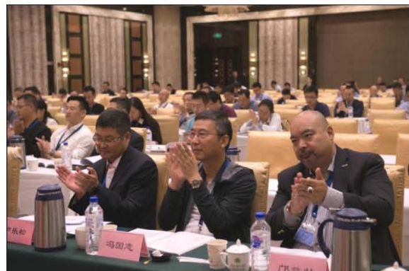
中国表面工程协会热喷涂专业委员会第六次会员代表大会及六届一次理事（扩大）会议