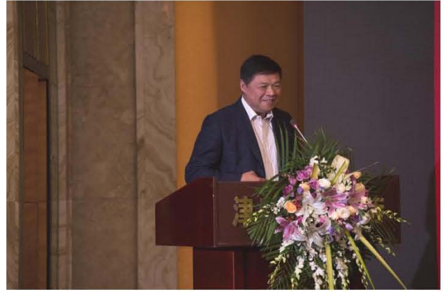
总会马捷秘书长宣读同意热喷涂专业委员会换届的批复并讲话，传达中国表面工程协会等有关精神