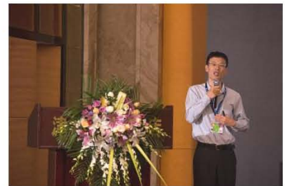
西安交通大学 李成新教授宣读论文