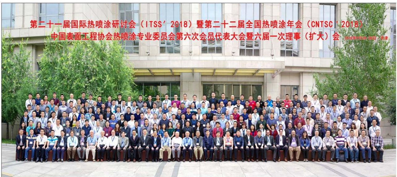
参会部分代表合影

在国内外热喷涂界同仁的大力支持和筹备组的精心组织下,由中国表面工程协会热喷涂专业委员会主办,天津铸金科技开发股份有限公司承办,航天材料及工艺研究所(703所)、中国科学院上海硅酸盐研究所、上海宝钢工业技术服务有限公司、广东省新材料研究所、中国科学院金属研究所、中国航发航空科技股份有限公司、江门市威霖贸易有限公司、武汉材料保护研究所、西安交通大学材料科学与工程学院、上海大豪瑞法喷涂机械有限公司、欧瑞康美科表面技术(上海)有限公司、北京联合涂层技术有限公司、上海岐海防腐工程技术有限公司、上海新业喷涂机械有限公司、成都振兴金属粉末有限公司、无锡新科表面工程材料有限公司、沈阳石花微粉材料有限公司、洛阳金鹭硬质合金工具有限公司、湖南兆益热喷涂材料有限公司、中国航发沈阳黎明航空发动机有限责任公司、中国航空制造技术研究院、自贡长城硬面材料有限公司、中国民航大学天津市民用航空器适航与维修重点实验室、株洲江钨博大硬面材料有限公司、东方电气集团东方汽轮机有限公司表面工程事业部、北京航天振邦精密机械有限公司、江西恒大高新技术股份有限公司、温州耐密特阀门有限公司、大连华锐重工特种备件制造有限公司、上海凯林新技术实业公司、无锡科特金属表面处理有限公司、江苏武进液压启闭机有限公司、北京华德星科技有限责任公司(德国IMPACT公司总代理、瑞士AMT公司总代理)、安徽省淮海工程科技有限公司、成都市长诚热喷涂技术有限责任公司、北京一同海瀛商贸有限责任公司(英国Metallisation公司总代理)、鞍山正发表面技术工程股份有限公司、浙江星塔科技设备材料有限公司、武汉高力热喷涂工程有限责任公司、洛阳朗力表面技术有限公司、西安宇丰喷涂技术有限公司、北京航百川科技开发中心、南通高欣耐磨科技股份有限公司、武汉理工大学、北京工业大学、《材料保护》杂志社、德国阿亨大学表面工程研究所、瑞士Oerlikon Metco公司、德国H. C. Starck公司、法国圣戈班公司、美国PRAXAIR/TAFA公司、瑞典HOGANAS公司、日本TOCALO公司、英国METALLISATION公司、德国热喷涂协会(GTS)、荷兰FST公司、美国金属学会热喷涂学会(ASM-TSS)、日本溶射学会、日本溶射工业协会等协办的第二十一届中国热喷涂研讨会(International Thermal Spraying Seminar' 2018)暨第二十二届全国热喷涂年会(China National Thermal Spraying Conference' 2018),于2018年9月25-28日在天津市成功举行,并同时召开了中国表面工程协会热喷涂专业委员会第六次会员代表大会及六届一次理事(扩大)会。本届大会的主题为“适应产业调整,开发新型产品,提供优质服务,锤锻专业队伍”。