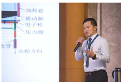
Thermico GmbH (Germany) 罗蔚峰博士作专题报告