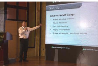
Green Belting Industries (加拿大绿带工业公司) Timothy Connelly 先生作专题报告